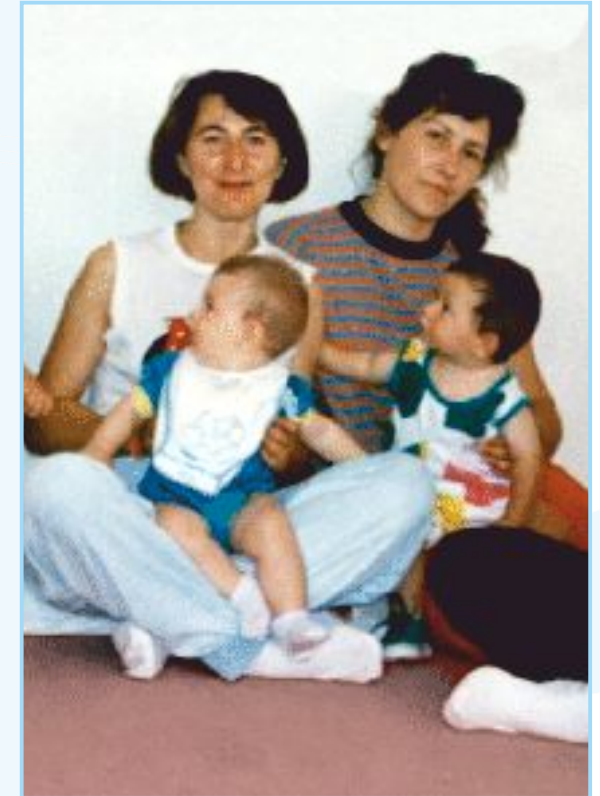
Incontri dopo parto