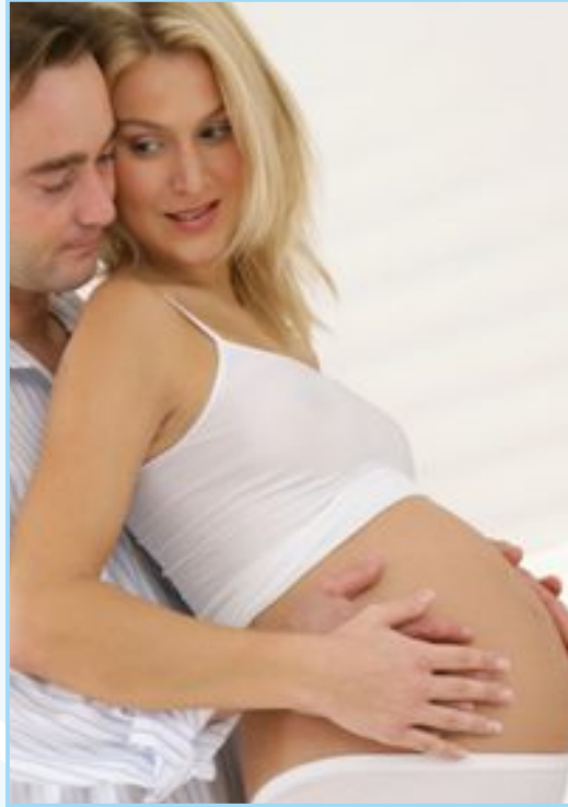
Corso di coppia