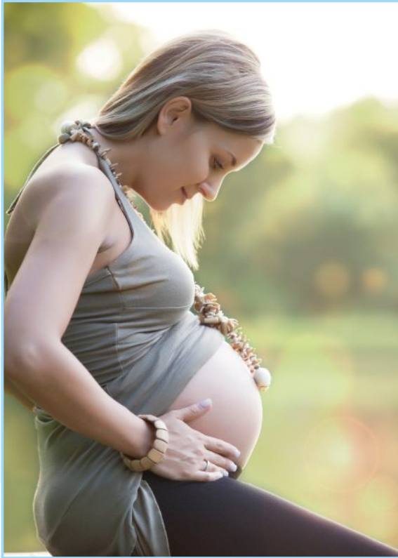
Corso per la gravidanza